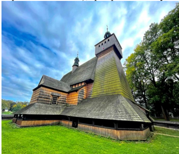
Kostol Nanebovzatia Panny Márie v Haczowe, PL

analýzy odborných expertov a špecifiká pohraničia. Predstavila 4 najdôležitejšie body nového Programu: starostlivosť o životné prostredie a obmedzenie nepriaznivých dopadov klimatických zmien (ochrana biodiverzity, prispôsob. zmenám klímy, ekologická uvedomelosť a spolupráca záchranných zložiek), udržateľná doprava (zlepšenie dopravnej dostupnosti pohraničia, zlepšenie dopravnej bezpečnosti, proekologické dopravné riešenia), podpora kultúry a