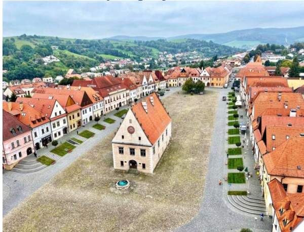
Radničné námestie v Bardejove, Slovensko

turistiky v ekonomickom rozvoji (hmotné a nehmotné kultúrne dedičstvo, cezhraničné systémy turistických informácií, sociálne začlenenie a inovácie, zvyšovanie zručností – napr. digitálnych – osôb pracujúcich v turistike a kultúre), spolupráca inštitúcií a obyvateľov pohraničia (zníženie právnych správnych bariér, výmena skúseností – napr. v oblasti profesijnej a sociálnej aktivizácie, inovatívnosť, ekologická a digitálna transformácia a realizácia malých projektov). Podstatné