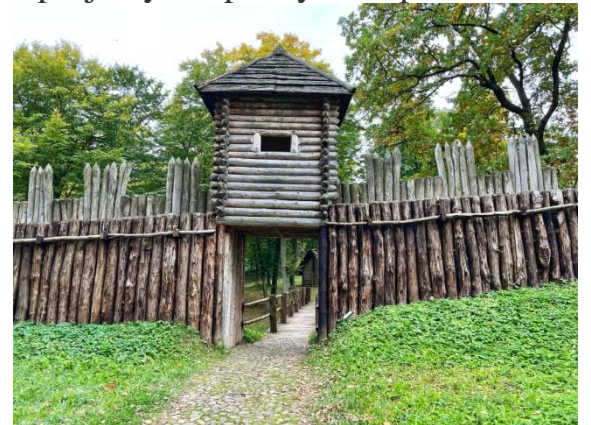
Archeoskanzen Karpatská Trója –Trzcinica PL

Skanzen sa nachádza na trase „Transkarpatského archeologicko-kultúrneho chodníka“ medzi Slovenskom a Poľskom a zahŕňa veľké množstvo archeologických a kultúrnych stanovišť. Karpatská Trója získala finančnú podporu v rámci programu Interreg PL-SK pre 3 projekty. Nepochybne prednosťou