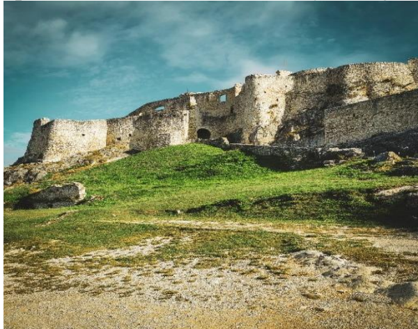
Spišský hrad – Slovensko

Paweł navštívili Spišský hrad a Spišské Podhradie, kde sa dochovalo okolo osemdesiat renesančných domov. V rámci projektov Interreg tu bola zrekonštruovaná Biskupská záhrada a kaplnky sv. Františka Xaverského a Rozálie nachádzajúce sa v takzvanom Spišskom Jeruzaleme. Oba blogeri