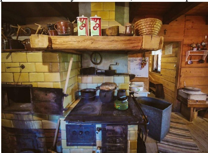
Chlebová chata – Górkí Male, Poľsko