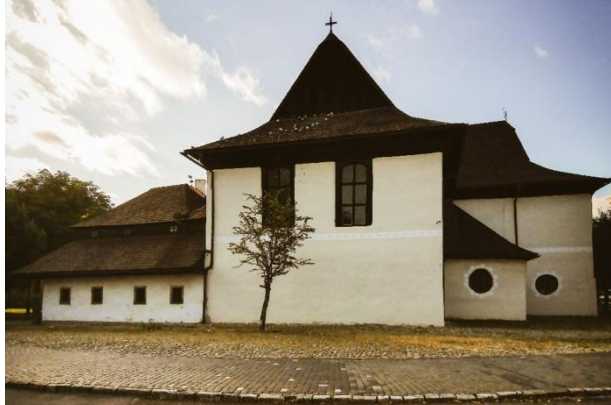
Kostol Najsvätejšej Trojice v Kežmarku, Slovensko