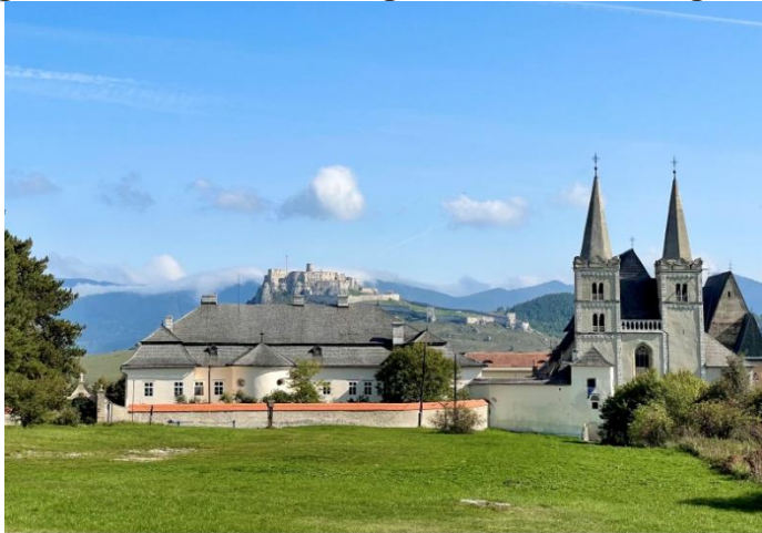
Spišské Podhradie, katedrála sv. Martina a Spišský hrad