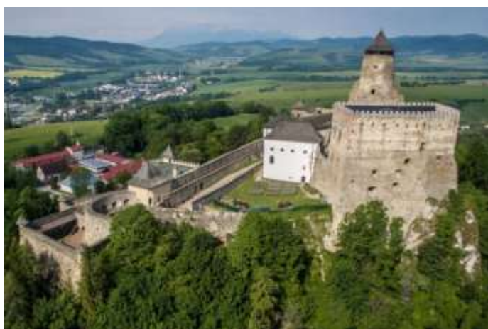
Pohľad na Ľubovniansky hrad a v pozadí mesto Stará Ľubovňa

Želám nám všetkým veľa vytrvalosti, optimizmu a najmä pevné zdravie. Opatrujte sa.