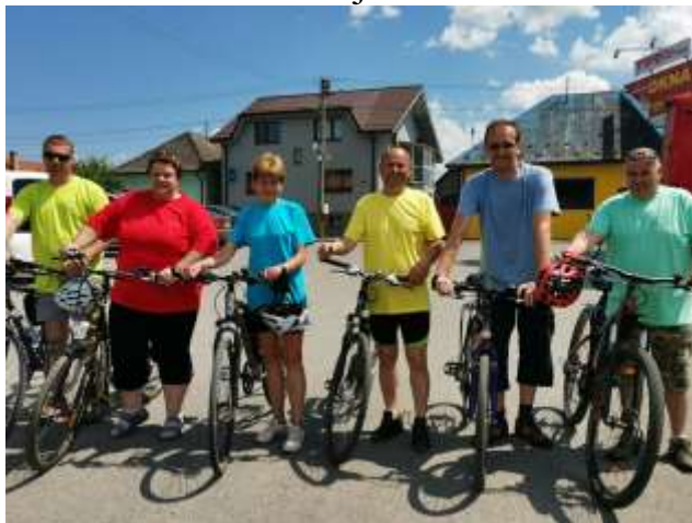
Zľava: starosta obce Hladovka, primátorka mesta Trstená, starostovia obcí: Čimhová, Liesek, Suchá Hora a Vitanová

Mesto Trstená v spolupráci s obcami Liesek, Čimhová, Vitanová, Hladovka a Suchá Hora zorganizovali dňa 20.06.2021 Rodinnú bicyklovačku samospráv na Ceste okolo Tatier na trase Trstená – Suchá Hora. Podujatie spoločne odštartovali štatutárni zástupcovia jednotlivých samospráv v Meste Trstená. Ďalší účastníci sa mohli pripojiť nielen v meste Trstená, ale aj v obciach Liesek, Vitanová, Hladovka, Suchá Hora, kde sú vybudované prístupové cesty na Cestu okolo Tatier. Pre najmenších účastníkov