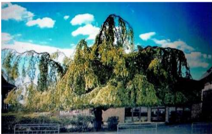
Buk lesný (Fagus sylvatica) – Starý Smokovec