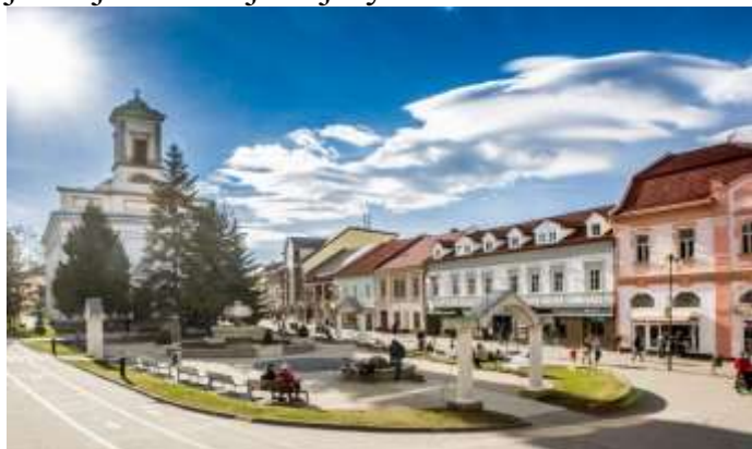
Fotografia zobrazujúca centrum mesta Poprad

Nepremrhajme tento potenciál a rozvíjajme úzku spoluprácu s poľskými partnermi. Projekt Euroregión Tatry je veľmi úspešný. Prináša zúčastneným rôzne ponuky projektov, ktoré náš región môžu skrásliť. Taktiež potrebujeme, aby návštevník z akéhokoľvek kúta sveta sa cítil príjemne na slovenskej alebo poľskej strane Tatier a nevnímal hranice ako prekážku na návštevu jednej či druhej krajiny.