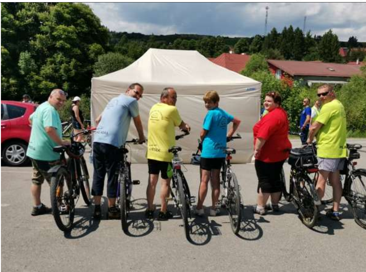
Rodinná bicyklovačka na Orave, zľava: starosta obce Hladovka, primátorka mesta Trstená, starostovia obcí: Čimhová, Liesek, Suchá Hora a Vitanová