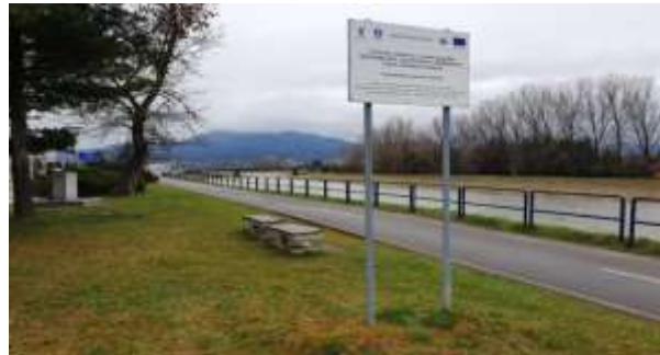
Plánované miesto osadenia cyklostanice - cyklochodník na mieste, kde sa spája 1. a 2. etapa projektu „Cesta okolo Tatier“, v blízkosti Palúčanského mosta

Cieľom projektu je prostredníctvom dobudovania cyklistickej infraštruktúry potrebnej na zabezpečenie náležitosti chodu cyklistickej dopravy v meste podporiť zníženie podielu motorovej dopravy. V rámci projektu sa vybudujú štyri cyklostanice v mestách Kežmarok, Liptovský Mikuláš, Trstená a Spišská Belá. Prístup k novovybudovanej infraštruktúre bude bezbariérový, nakoľko sa bude nachádzať hneď popri cyklistických chodníkoch. Vzniknutú