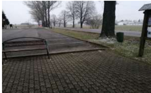
Plánované miesto osadenia cyklostanice - lokalita Beliansky rybník, začiatok cyklotrasy Spišská Belá - Tatranská Kotlina

Ministerstvo investícií, regionálneho rozvoja a informatizácie SR vyhlásilo dňa 15. marca 2021 výzvu na predkladanie žiadostí o poskytnutie dotácie v oblasti podpory regionálneho rozvoja. Príprava projektu prebehla v spolupráci s mestami Kežmarok, Spišská Belá, Liptovský Mikuláš a Trstená.