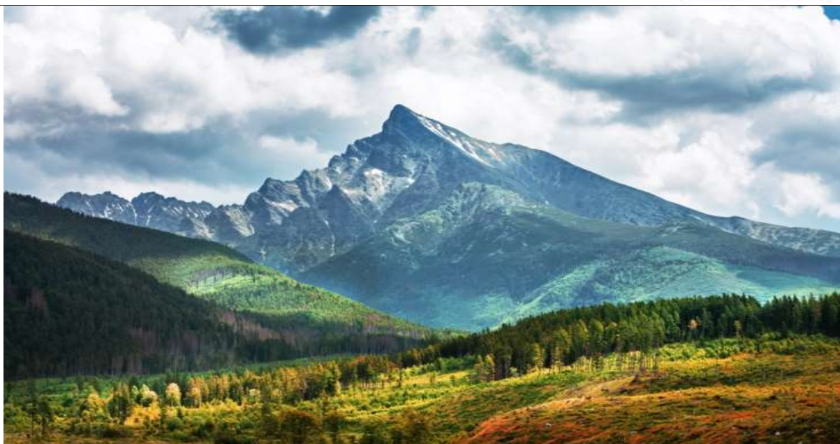
Vysoké Tatry – pohľad na vrch Kriváň