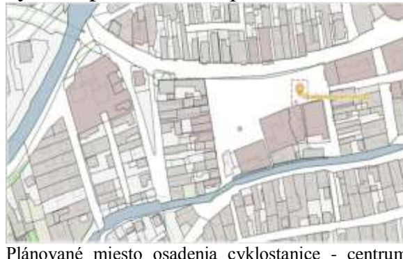
Plánované miesto osadenia cyklostanice - centrum mesta Trstená, námestí M. R. Štefánika

cyklotrasy budú lákadlom pre športovo nadšených turistov i návštevníkom, ktorí hľadajú aktívny oddych a ktorí majú záujem spoznávať okolie spomínaných regiónov. Všetky miesta realizácie budú prístupné bezplatne pre širokú verejnosť, bez ohľadu na pohlavie, rasu, vek, zdravotný stav, sociálny status a pod. a budú bezbariérové. Zvýši sa tým záujem turistov o cyklodopravu a stúpne návštevnosť