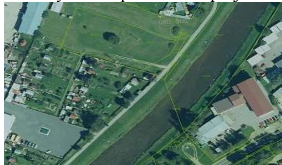
Plánované miesto osadenia cyklostanice - cyklotrasa Kežmarok - Huncovce

jednotlivých regiónov na celom území Euroregiónu Tatry. Tento záujem o turizmus bude mať vplyv aj na rozvoj cestovného ruchu na území (ubytovanie, stravovanie, oddych, relax a pod.), výsledkom čoho bude nárast návštevnosti a udržanie si turistov aj na dlhšie obdobie, ako sú víkendové pobyty. Na území Euroregiónu Tatry je veľa možností a ponúk, ako tráviť voľný čas a preto je veľmi dôležité ho neustále zveľaďovať a propagovať aj širokému okoliu, návštevníkom, či turistom. Celkový rozpočet projektu